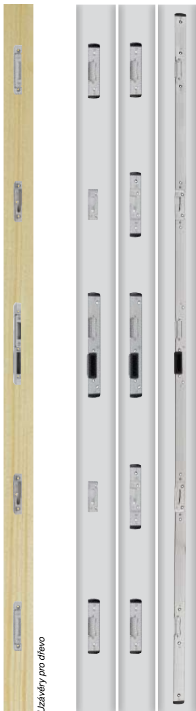
Uzávěry pro dřevo